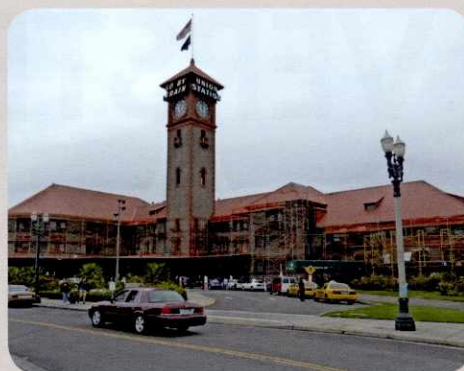
Het oude 'Union station' wordt weer opgeknapt