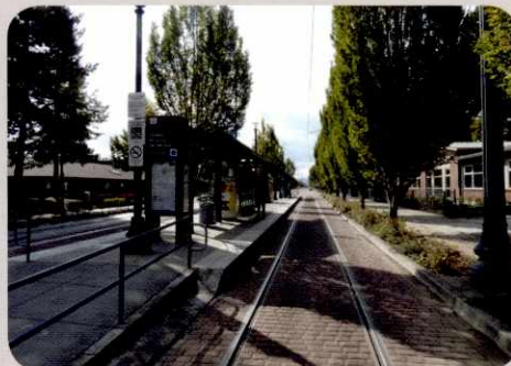
De auto maakt plaats voor de tram in de suburbs